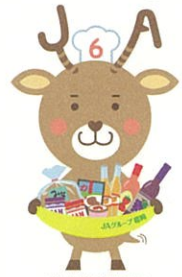
6次化商品宣伝隊長 ろくじかクン ©JAグループ編纂

「6次化商品」とは、地元の農産物を原材料に作る加工食品のこと。 糸島産の美味しい素材を、さらに美味しく商品化しました。