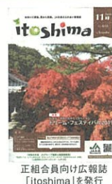
正組合員向け広報誌 「itoshima」を発行