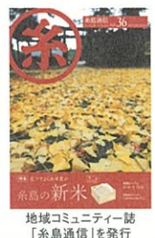
地域コミュニティー誌 「糸島通信」を発行