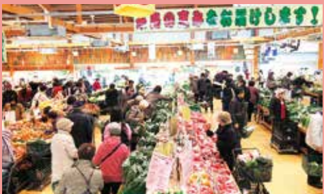
いつも大勢のお客さんと販売している「伊都菜彩」

特に農業は皆様の口に入るモノ、食を支える生命産業ですから、単に売れば良いというものではありません。安全なモノ、安心なモノが大切です。特に糸島産の農畜産物は、福岡都市圏をはじめ全国各地の市場を取引先としており、青果物などは京都や広島