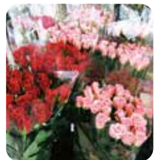
▲選花が終わり、出荷される直前のバラ。