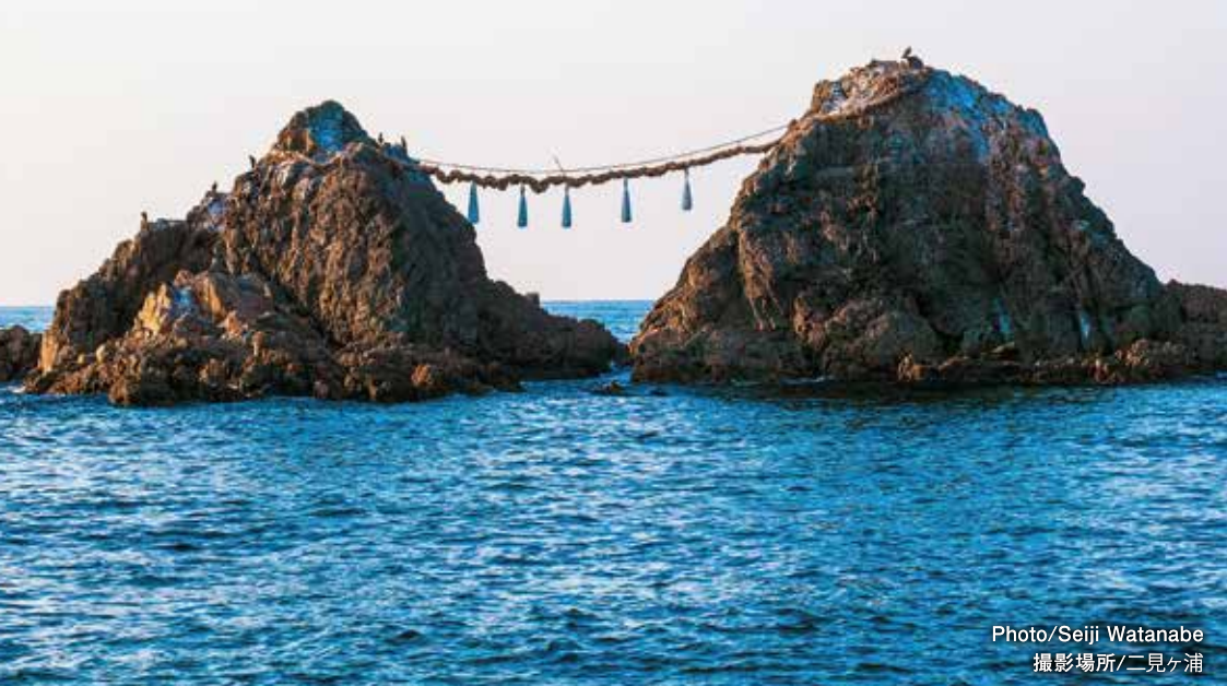
撮影場所/二見ヶ浦