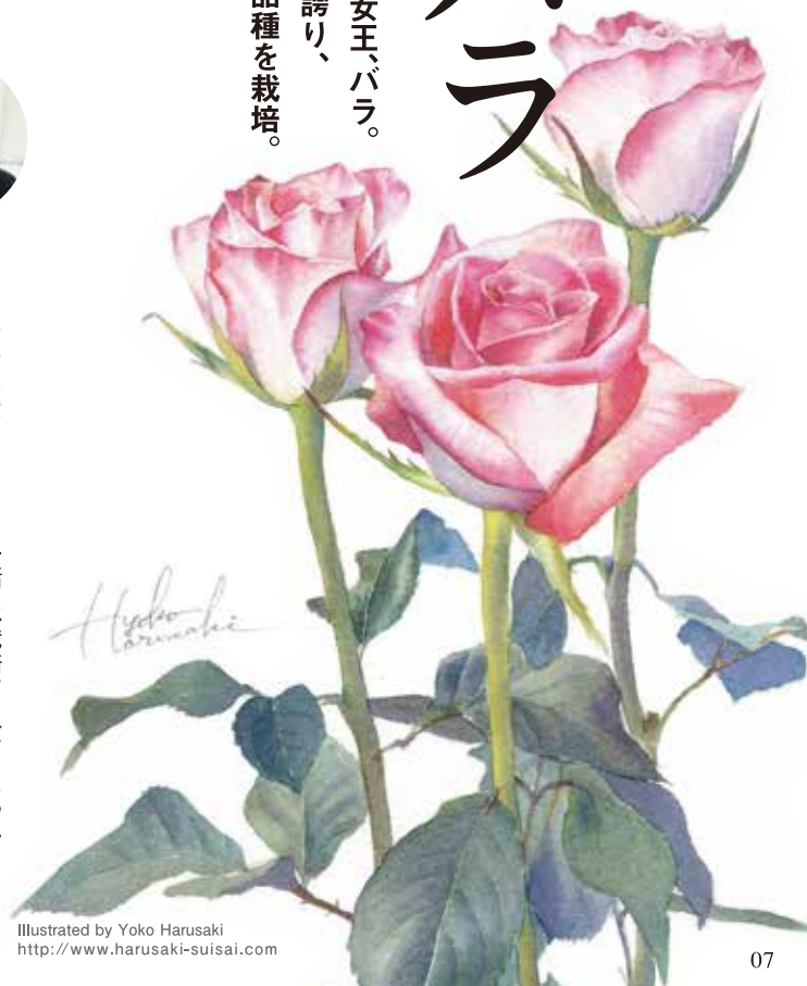
Illustrated by Yoko Harusaki http://www.harusaki-suisai.com

ポピュラーで気品あふれる花の女王、バラ。 福岡県は全国4位の生産量を誇り、 糸島では6戸の生産者が約60品種を栽培。 厳しい選花を経て届けられる 糸島生まれのバラは、 鮮度と品質の良さが自慢です。