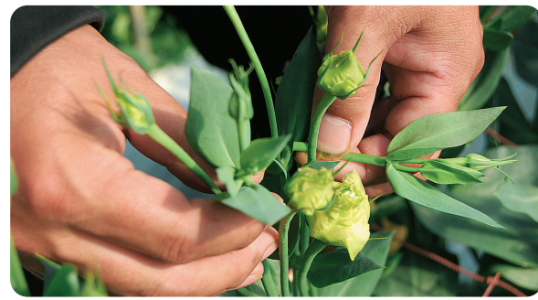
▲形を整えるため、余分な茎葉は取り除き、出荷調整へ。

出荷までは、繊細な花びらが焼けないようにハウスを管理し、見栄えよく揃えるため、不要な枝葉を取り1枝に花1輪と蕾2輪の形に手作業で調整していきます。去年は40万本と順調な出荷を終えたそうですが、「1本でも多く出荷すること」が部会のモットー。