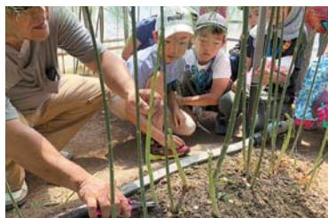
「JAキッズスクール」は、市場への社会科見学や料理教室など、農業を楽しむ学べる機会になっています。