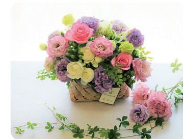
▲トルコキキョウのフラワーアレンジメント。