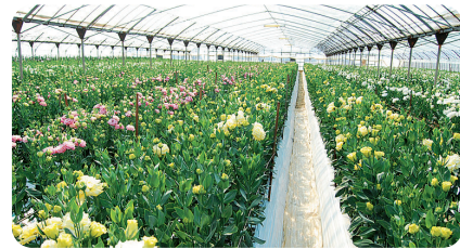
▲ともに50アールのハウスで栽培。

冠婚葬祭から小売りまで、人気の高いトルコキキョウの他にも花卉を栽培する二人。「好きな花を1輪でいいので家族にプレゼントしたり、安らぎやゆとりを感じてほしい」とメッセージを送ってくれました。