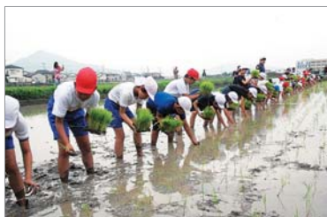
管内小学校の子どもたちに田植え授業や稲刈りなどのお手伝いをしています。

JAの事業や活動はSDGsの目標に自然につながっているものばかりです。例えば、安心安全な農畜産物の提供は、目標2の「飢餓をゼロにする」に、新たな就農者が増えることや集出荷場等での雇用が生まれることは目標8の「経済成長と雇用」につながっています。また、JAの得意分野である食農教育活動は、目標4の「教育」とつながり生涯学習の機会を与えています。