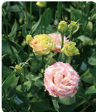
▲フリンジが華やかな八重咲き、バイカラーなど人気のセレブシリーズ。