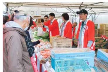
「ドリームフェスティバル」は食と農、そして地域を結ぶ住民参加型イベントとして開催しています。