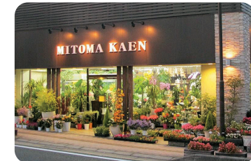
▲生花の花束、アレンジメントだけでなく、観葉、鉢物のラインナップも豊富。