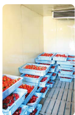
鮮度を守るため、2℃に設定した専用の冷蔵庫で保管します。