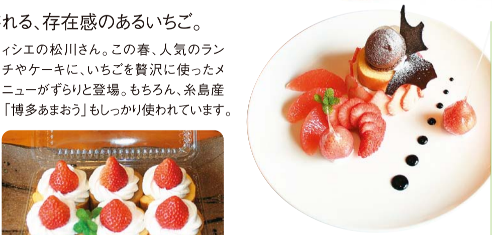
人気のランチコース(¥1,500)についてくる血盛りデザートにも、糸島産のいちごが贅沢に(内容は日替り)。

●パティスリー・リベルル／とんぼ 福岡県糸島市南風台8-3-1 TEL/092-321-1671 10:00～21:00 ケーキテイクアウト 11:30～14:30 ランチ/14:30～18:00 喫茶 18:00～21:30 居酒屋