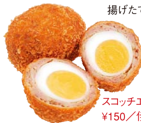
スコッチエッグ(1個) ¥150 / 伊都菜彩

『伊都菜彩』の惣菜コーナーに、登場するやいなや売切れ続出の新品「スコッチエッグ」。糸島たまごと福岡県産の牛豚ミンチを使ったこだわりの一品です。ぜひ揚げたてをどうぞ。