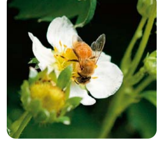
ミツバチによる自然受粉によって生まれる博多あまおう。

この大きさ!さすがは、あまおうの貴族です。苗の植え付けは9月から10月初旬にかけて。夏に一度苗を冷蔵して花芽を早くつけさせることで、昔は春の果物だったいちごがクリスマス前から収穫できるようになりました。「いちごは気温が高くなる前に摘み取るのが大事だから、一番よく実がつく春先シーズンは夜明け前の4時頃から作業しますよ」。収穫が済むと、今度は家でバック詰め作業。これが5月頃まで続きます。「忙しくて作業も大変ですが、全国でも人気の高い自慢のあまおう作りですから、働き甲斐もありますよ」と、摘み取る手もキビキビと動いていました。